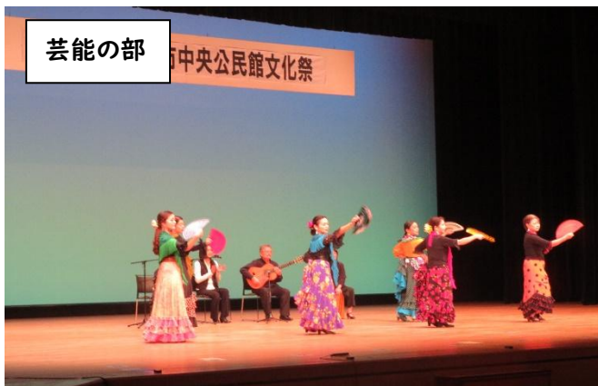
令和7年度 文化祭の様子