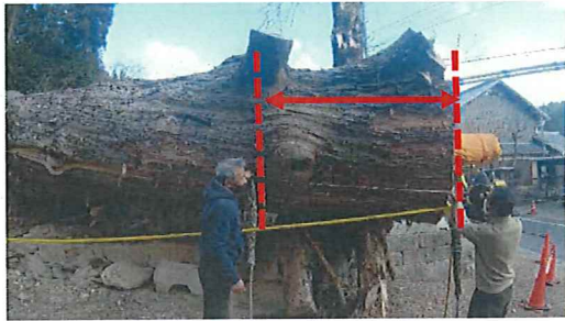
◎保存・活用の模式図