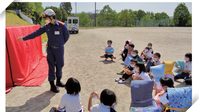
命を守る訓練(防災)