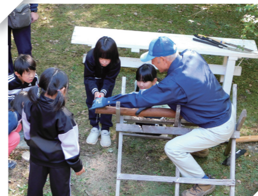
コミュニティ・スクールの様子