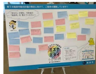
※実際の設置の様子