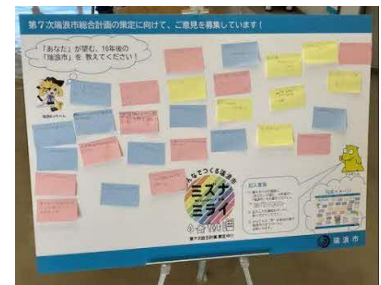
※実際の設置の様子