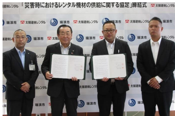
太陽建機レンタル（株）との協定締結式

市長が腰かけているのは、段ボールベッド 背景は段ボールパーテーション（間仕切り）