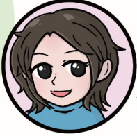
木村由莉 (国立科学博物館 研究員)

知っているつもりだけでは解けない古生物の気づきがいっぱい!問題を解くごとに一歩ずつ化石マスターに近づけます。易しくない問題に「う〜ん」となったら、ふしぎがいっぱいの化石の世界にようこそ!