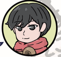
相場大佑 (深田地質研究所 研究員)

知っているつもりだけでは解けない古生物の気づきがいっぱい!問題を解くごとに一歩ずつ化石マスターに近づけます。易しくない問題に「う〜ん」となったら、ふしぎがいっぱいの化石の世界にようこそ!