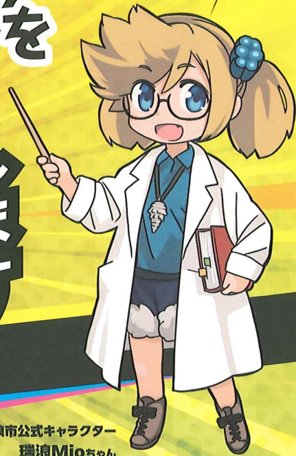
瑞浪市公式キャラクター 瑞浪Mioちゃん