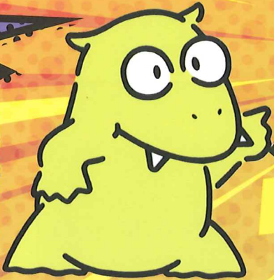
瑞浪市公式キャラクター デスマモン