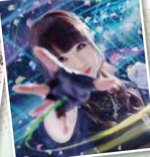
佐倉ユキ (シンガー)