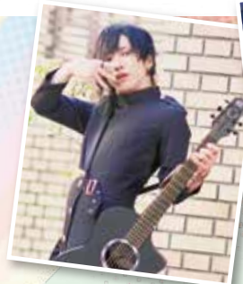
ぜるেশア (ギタリスト)