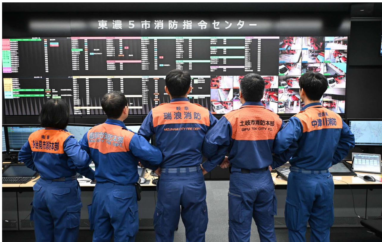
令和8年4月 東濃5市消防指令センター運用開始