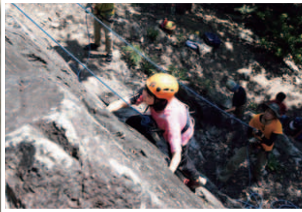
岩の形を確かめながら一歩一歩