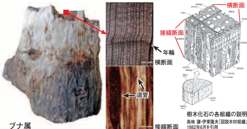
樹木化石の各組織の説明 島地 謙・伊東隆夫「図説木材組織」 1982年6月を引用

これまでも、市内からブナ属の葉化石は見つかっていましたが、葉は風などで運ばれやすく、1900万年前の付近の山から飛んできた可能性もありました。今回の樹種特定により、当時の土岐町付近にブナ林が広がっていたという新事実が判明しました。そして今回の発見は、当時の瑞浪市周辺は冷涼な気候下であったことの裏付けが強まったといえます。