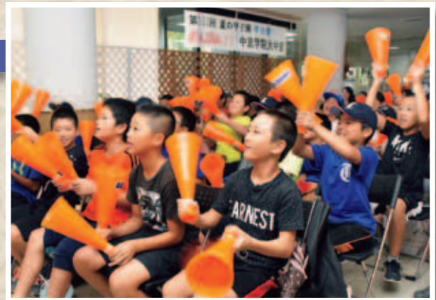
ファインプレーに興奮!

交流スペースに特設された大型モニターの前には、地元の野球少年など約80人が集まり、熱い声援を送りました。