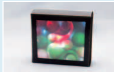
*パッケージデザインは変更になる場合があります。