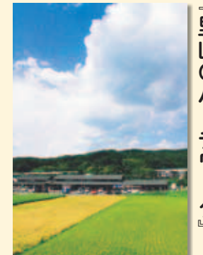
『里山のパッチワーク』 優秀賞