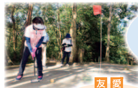
▲マレット ゴルフ大会

明るい長寿社会づくりと 保健福祉を向上する活動 軽スポーツ大会、マレット ゴルフ大会、体力測定など