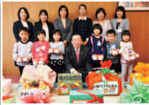
大きくなっても優しい気持ちを忘れないでね