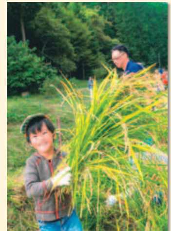
『こんなにたくさんとれたよ!』 最優秀賞 市長賞