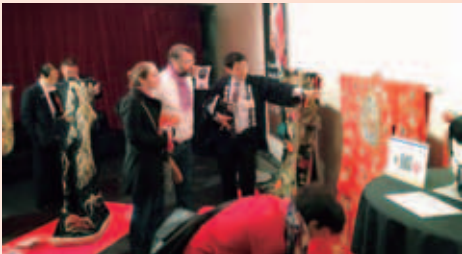
フランスでの展示解説