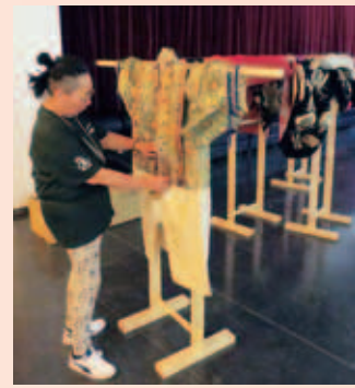
フランスでの展示準備

他に、振袖打掛や役物衣裳、また特殊な仕掛けをした衣裳「ぶっかえり」が展示されました。展示は美濃歌舞伎保存会が行い、衣裳を展示するための衣桁は、組立材料の生木を海外へ送ることができないことが判明したため、生木を乾燥しニスを塗る工夫をしました。衣裳はスーツケースに入れ、鬘は専用の箱を作り直接現地へ運び込みました。鬘は人間の髪を使っているため、検査のために空港で箱から出すことになった事態にも遭遇。輸送後、現地で展示を行いました。スペインでは会場の都合で棒と紐を用い、壁にかけて展示を行うなど苦労が絶えませんでした。