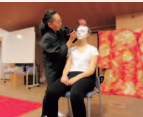
サラマンカ大学での体験講座 (左上)サラマンカ大学日西センター (左下)日西センターでの展示