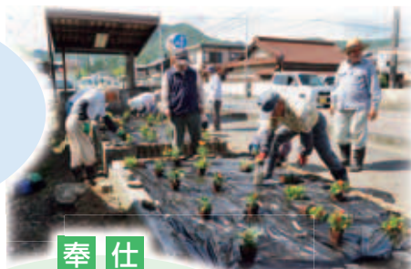
▲地域行事への 参加の様子

知識や経験を生かして地 域の諸団体と共同し、地 域を豊かにする社会活動 地域行事への参加、地域の 清掃、通学見守り活動など