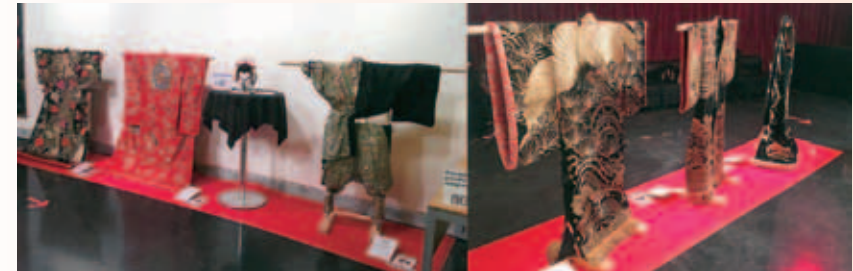
美濃の地歌舞伎衣裳フランスでの展示