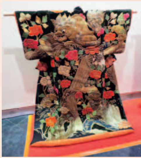
黒天鷲絨地 金繡牡丹・唐獅子文 金馬簾付 フランスでの展示風景

他に、振袖打掛や役物衣裳、また特殊な仕掛けをした衣裳「ぶっかえり」が展示されました。展示は美濃歌舞伎保存会が行い、衣裳を展示するための衣桁は、組立材料の生木を海外へ送ることができないことが判明したため、生木を乾燥しニスを塗る工夫をしました。衣裳はスーツケースに入れ、鬘は専用の箱を作り直接現地へ運び込みました。鬘は人間の髪を使っているため、検査のために空港で箱から出すことになった事態にも遭遇。輸送後、現地で展示を行いました。スペインでは会場の都合で棒と紐を用い、壁にかけて展示を行うなど苦労が絶えませんでした。