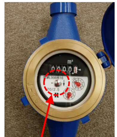
水道メーターのパイロット