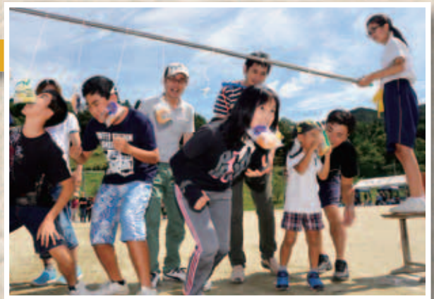
世代を超えて 楽しく交流

パン食い競走など14種目が行われ、地区別に分かれた参加者は、所属分団を勝利に導くため、各種目で熱戦を繰り広げていました。