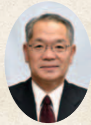
瑞浪市教育長 平林 道博