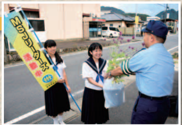
「いつも見守っていただきありがとうございます！」

生徒は、日頃から見守りなどでお世話になっている地元の施設や店舗に、6月から水やりなどをして大切に育ててきたセンニチコウの花を、感謝の言葉を添えて届けてまわりました。