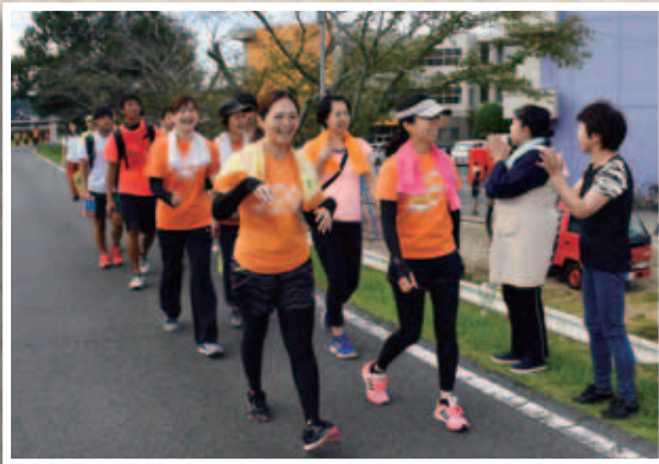
認知症をあたたかく見守る地域を目指して