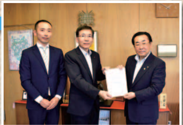
条例の運用状況などについて検証していきます

加藤会長は、「条例が目指す『市民一人ひとりが瑞浪市民であることに誇りを持ち、幸せな暮らしを実感できるまちづくり』を実現するため、検証を続けてまいります」と話しました。