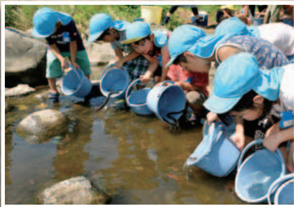
大きくなって帰ってきてね