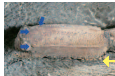
タラシナ・ツヤメンシス(新種・掌節)

岡山県津山市から見つかったオキナワアナジャコ属化石を詳しく調べると、 しょうせつ 掌節(ツメの部分)の表側に顆粒列(列状にならんだ粒)が3列あることが分かりました。オキナワアナジャコ属は、平成