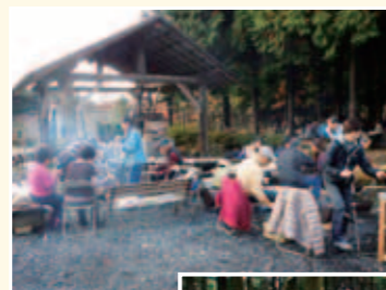
現在のバーベキュー場

天神窯周辺は、琵琶峠、天狗塚、マレットゴルフ場など、自然景観に恵まれた総合的なレクリエーションの場となっています。東屋の設置による休憩場の整備、バーベキュー設備の設置による交流の場の拡充を行い、来訪者の増加につなげ、活気ある地域を目指します。