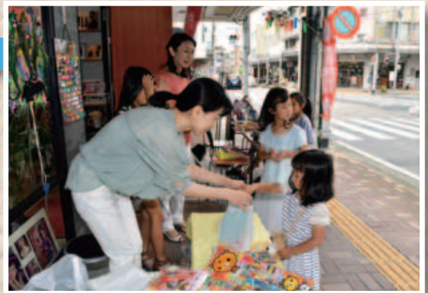
次回は10月8日(土)に開催予定

全60店舗が独自に考えた自慢の100円商品を目当てに、子どもから大人までが商店街での買い物を楽しみました。