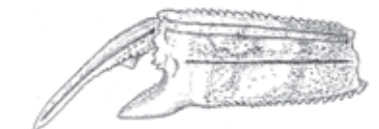
タラシナ・ツヤメンシス(ツメの部分の復元図)

27年の時点で現生種9種と化石種1種が確認されていましたが、顆粒列が3列ある種類は、化石種の Thalassina emerii (タラシナ・エメリーイ) と現生種の T. saetichelis (タラシナ・セチケリス) の2種のみです。