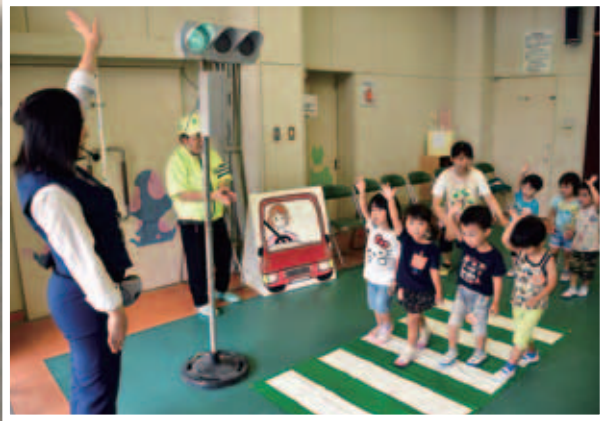
一旦止まって安全確認