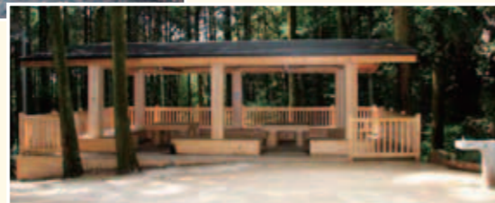
東屋完成イメージ