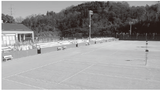
▲ぎふ清流国体会場整備