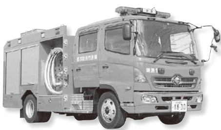
▲消防車両・救急車両等更新事業

一般会計の歳出総額は140億7757万円、前年比△8億6497万円、5.8%の減となりました。減少の要因は、前年度に戸狩半原線道路改良事業や定額給付金事業などの大規模事業を実施したことなどによるものです。また、平成22年度には、消防車両・救急車両等更新事業や小中学校太陽光発電設備導入事業などを実施しました。財政状況は依然として厳しく、経費節減に努め、市民の安全・安心対策や教育・福祉などの事業は積極的に推進し、市民一人ひとりが快適に暮らせるまちづくりにつながるよう努めています。