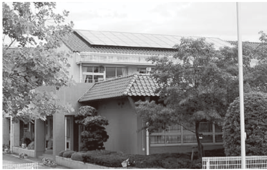
▲小中学校太陽光発電設備導入事業