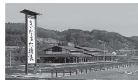
▲農産物等直売施設整備事業

平成23年度決算については、9月市議会定例会に提出され、同定例会にて承認されました。 一般会計の歳出総額は138億5,459万円、前年比△2億2,297万円、1.6%の減となりました。これは、平成22年度に民間社会福祉施設等整備事業や、ぎふ清流国体会場整備事業などの大規模な事業が完了したことによるものです。 一方で、平成23年度においては農産物等直売施設整備事業や地球温暖化防止対策推進事業、災害支援事業などの事業を実施しました。財政状況は依然として厳しいなか、経費節減に努め、市民の安全・安心対策や地域活性化対策などの事業を積極的に推進し、市民一人ひとりが快適に暮らせるまちづくりにつなげていきたいと思います。