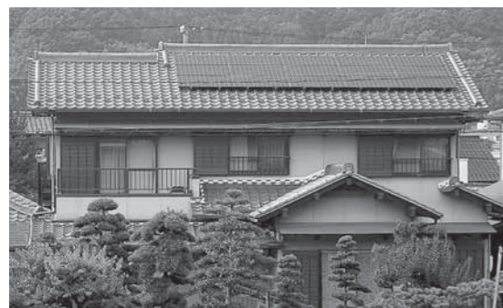
▲地球温暖化防止対策推進事業

平成23年度は前年度と同様に財政融資資金などの政府資金を主な借入先としています。市債残高は総額で減少しており、市債は、返済能力範囲内で計画的に活用しています。