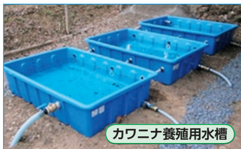
カワニナ養殖用水槽