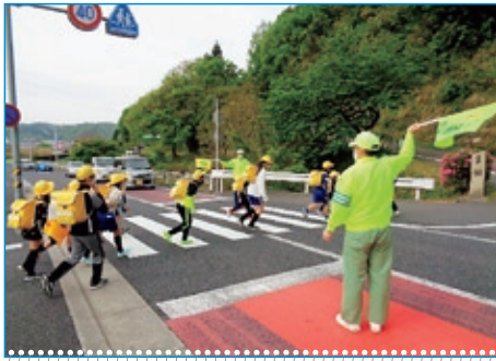
登校見守り (小学校下)