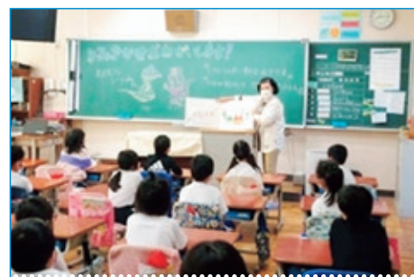
読み聞かせ (全学年)