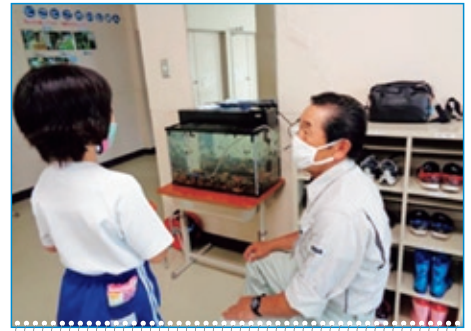
ホタル幼虫育成 (明世小玄関)