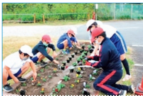
花の苗 植栽 (6年生)