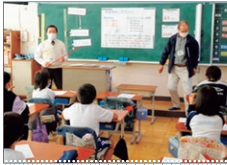
ホタル勉強会 (5年生)