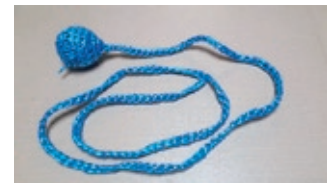
中身はゴルフボール