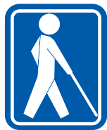
盲人のための 国際シンボルマーク

視覚障がい者が 白杖を高く掲げて 周囲に手助けを 求めるシグナル を啓発するための マーク。