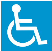
障害者のための 国際シンボルマーク