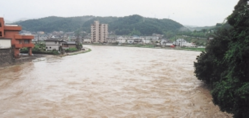
集中豪雨 (和合橋上流部)