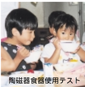
陶磁器食器使用テスト