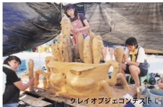
クレイオブジェコンテスト