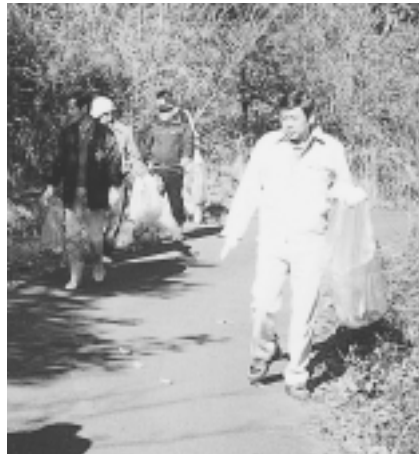
11/21 松野湖クリーン大作戦（日吉町）