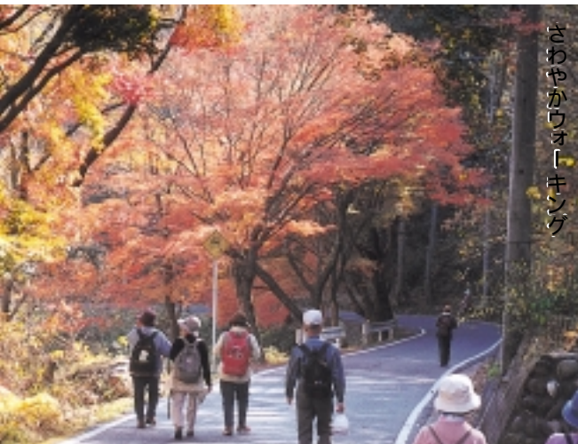
さわやかウォーキング