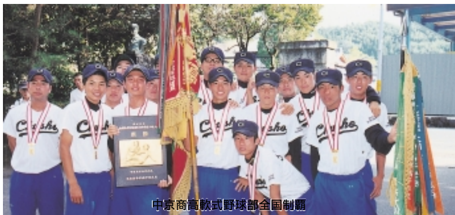
中京商高軟式野球部全国制覇