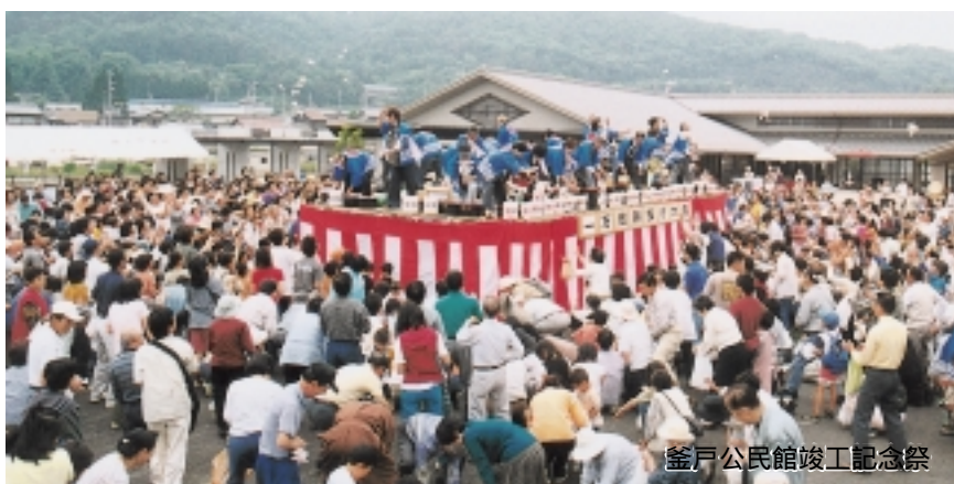
釜戸公民館竣工記念祭