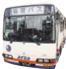
コミュニティバス