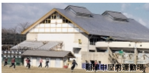
稲津中屋内運動場