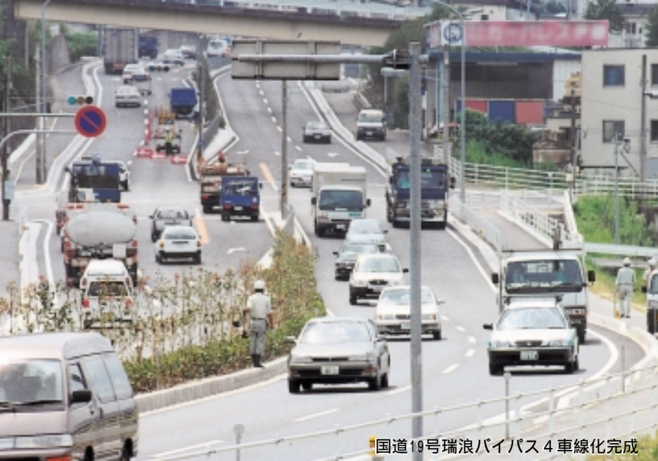
国道19号瑞浪バイパス4車線化完成