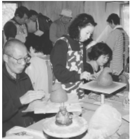
11/21 えとの置物づくり（陶磁資料館）