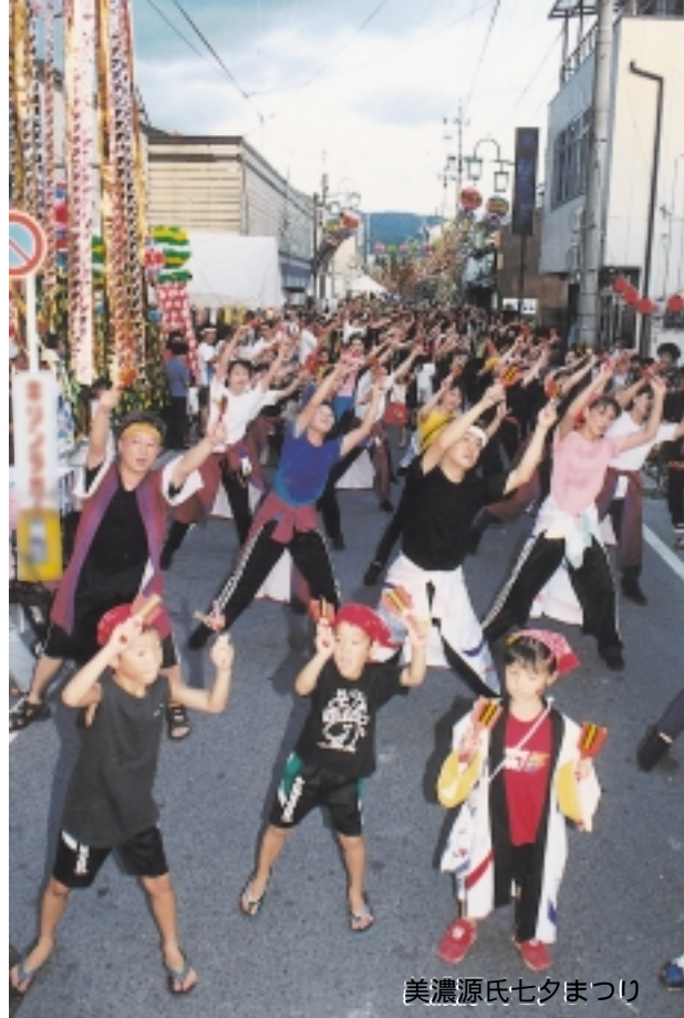
美濃源氏七夕まつり