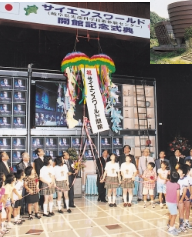
サイエンスワールド