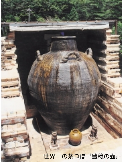
世界一の茶つぼ『豊穰の壺』