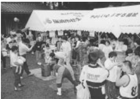
6月20日、生活ホーム『じゃがいも』の第6回『じゃがいも