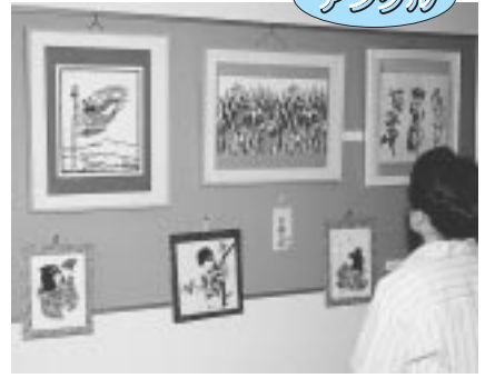
▲白寿荘作品展 (於 陶ワークプラザ) 7月31日まで