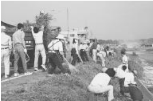
環境月間の6月6日、『土岐川