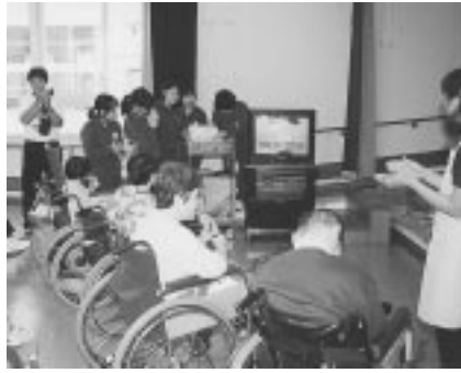
▲6/8 陶中学、サニーヒルズ園生と交流