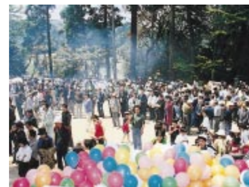
▲ 祝賀会（大川八王子神社境内）