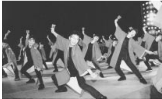
▲昨年のYOSAKOIソーラン祭り

「まちの元気は、おかみさんから」この言葉から生まれた新たな振付曲「おかみさんソーラン」を引っ掛けて、バサラ瑞浪が、6月11日から北海道札幌市で開催される「YOSAKOIソーラン祭り」に出場します。ここ瑞浪を発祥とする新たな踊りが、今後全国津々浦々のおかみさんたちによって踊られることでしょう。いま、七夕まつりに向け、各地でバサラの輪が広がっています。踊りの好きな人、踊りを覚えたい人、初心者大歓迎です。ぜひご参加ください。