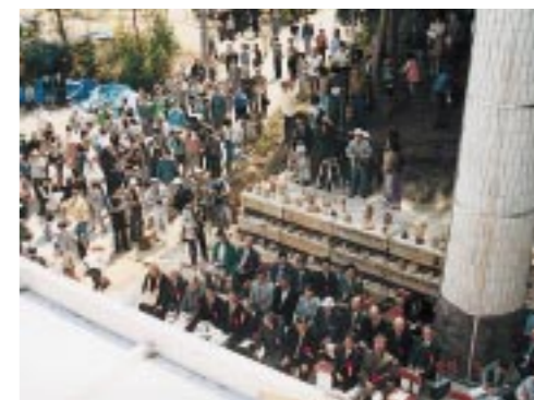
▲ 窯屋根から式典を望む