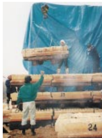
▲ 窯を築く（平成11年3月）