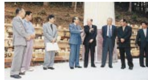
▲ 梶原拓岐阜県知事を迎えて（平成11年5月10日）