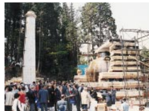
▲ 全 景