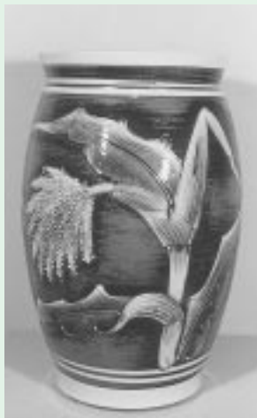
▲弥吉作「唐黍文花瓶」

期間 6月1日(火)から8月1日(日)まで 場所 瑞浪陶磁資料館 (☎67-2506)