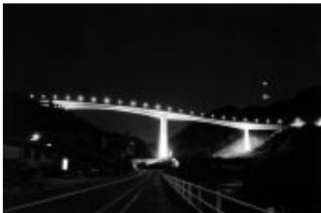
▶ライトアップされた小里城大橋

写真は、三重県大山田村から発見された1700万年前のヒゲクジラの頭骨と上アゴです。長さは1mもある立派なもので、現在、研究中の標本です。ナガスクジラの遠い先祖にあたるものでしょう。同じ種が、瑞浪や岩村からも見つかっています。