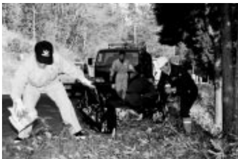
▶清掃作業をするみなさん

冬の澄み切った夜空に浮かび上がる幻想的な姿は、道行く人たちの目を楽しませていました。