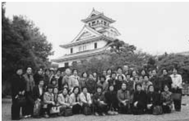
今年の文学散歩(長浜城)

1月26日(土) 13時30分～ 総合文化センター講堂 不思議な手品や人形劇など、楽しい催しがいっぱいです。みんな遊びにきてね!