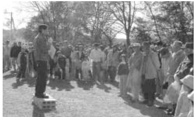
松野湖クリーン作戦

11月17日・18日、釜戸町から大湫町を歩く「秋のさわやかウォーキング」が行われました。4回目を迎えた今年は、一部コースが変更されましたが、連日各所で様々なイベントが開催され、約4000人が訪れました。