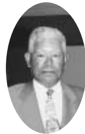
稲津宅老所運営委員会