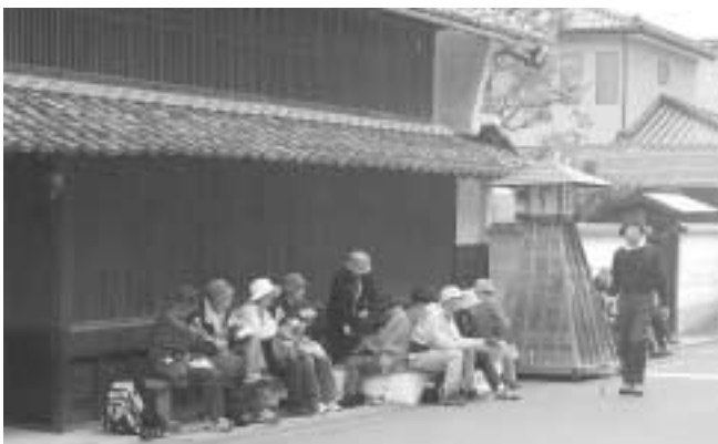
秋のさわやかウォーキング

11月17日・18日、釜戸町から大湫町を歩く「秋のさわやかウォーキング」が行われました。4回目を迎えた今年は、一部コースが変更されましたが、連日各所で様々なイベントが開催され、約4000人が訪れました。