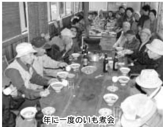
年に一度のいも煮会

市内でも競技人口が増えつつあるグラウンドゴルフを通じ、盛んな活動が行われているのが、釜戸町平山区です。