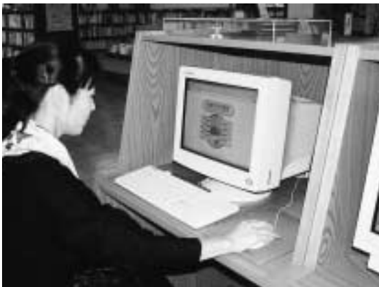
ホームページより図書検索する利用者