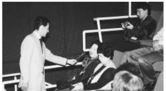
環境フェアみずなみ2001(式典) 宇宙飛行士 毛利衛さん登場 (10月27日サイエンスワールド)