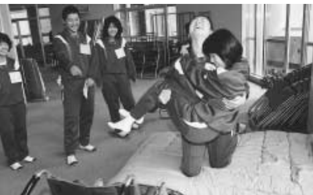
チャレンジ 福祉体験 (11月7日陶中学校)