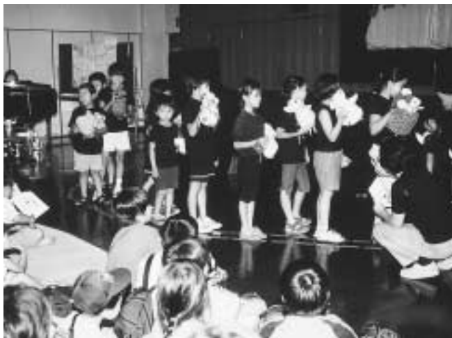
瑞浪子ども劇場 ワクワクわんぱくランド (7月15日 総合文化センター)