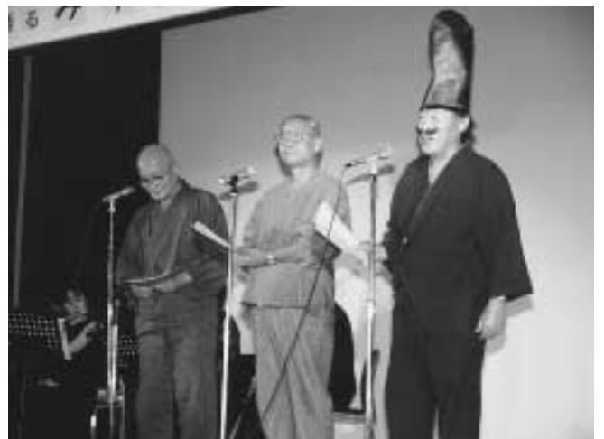
七夕コンサート 方言で語るみずなみの昔話 (7月8日 ミュージアム中山道)