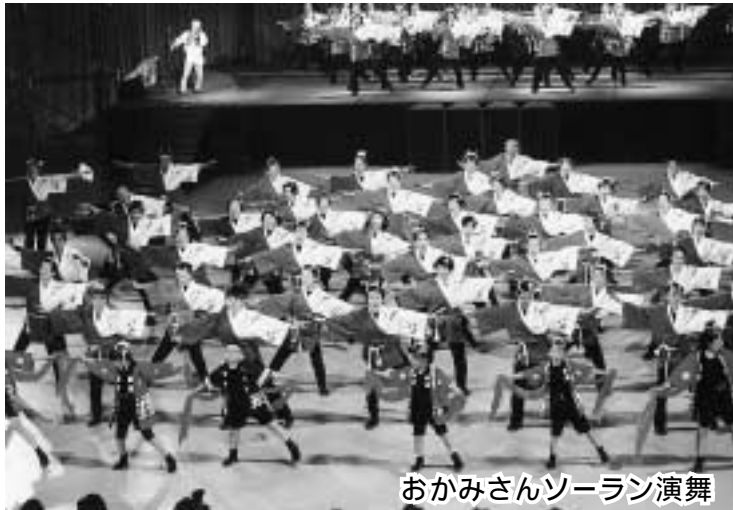
おかみさんソーラン演舞

踊ってまちを元気にする「バサラ瑞浪」チーム120人が6月8日～10日、札幌市で開かれた第10回YOSAKOIソーラン祭りに参加しました。