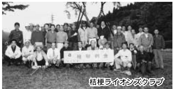
桔梗ライオンズクラブ