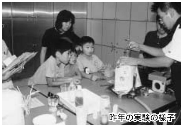
昨年の実験の様子