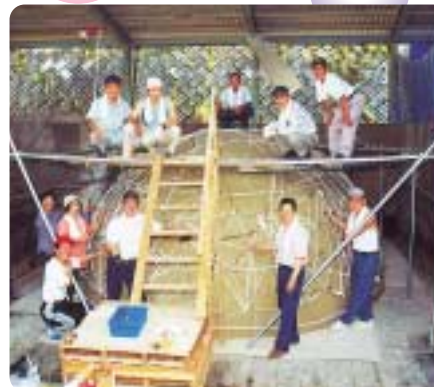
7月2日 本体の粘土成型が半分完成

釜戸町の竜吟峡入口で、昨年5月から制作されてきた、竜の陶製モニュメント「ドラゴン21」が4月14日完成しました。