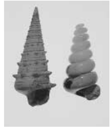
ピカリア 月のおさがり