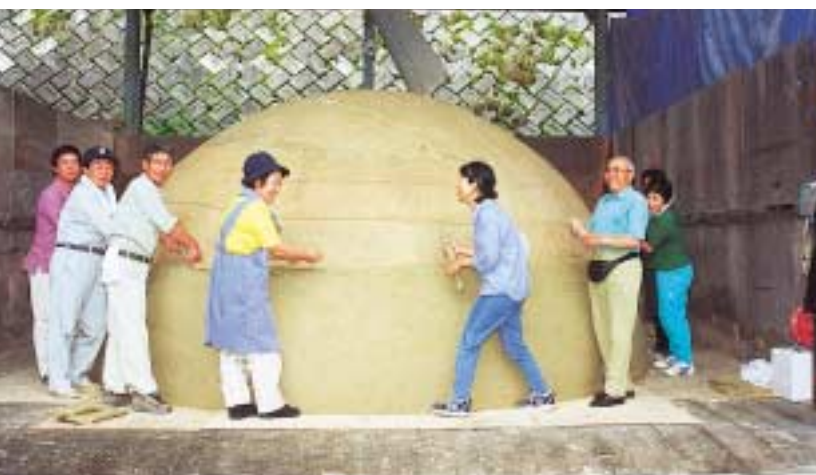
6月18日 本体の粘土成型