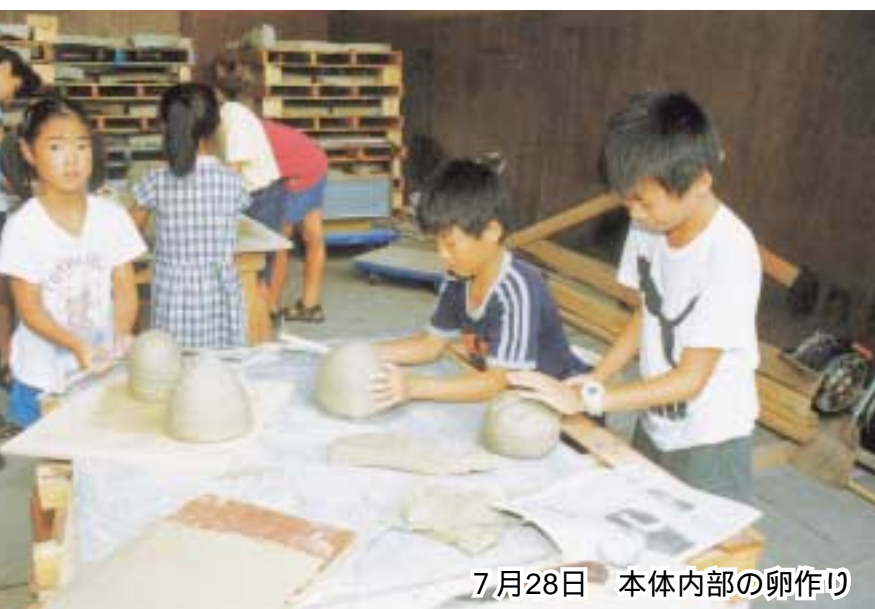
7月28日 本体内部の卵作り