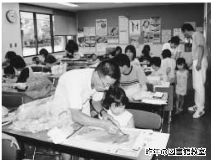
昨年の図書館教室