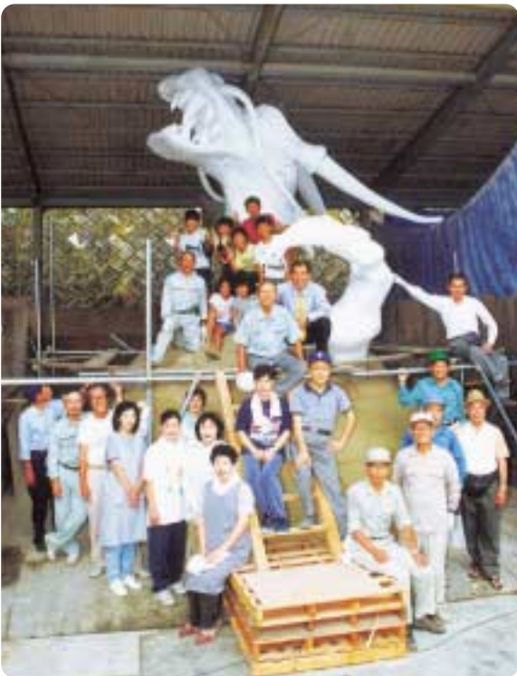
7月28日 頭部の模型を仮組み