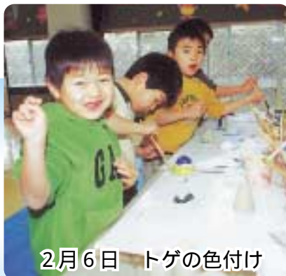
2月6日 トゲの色付け