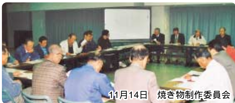
11月14日 焼き物制作委員会