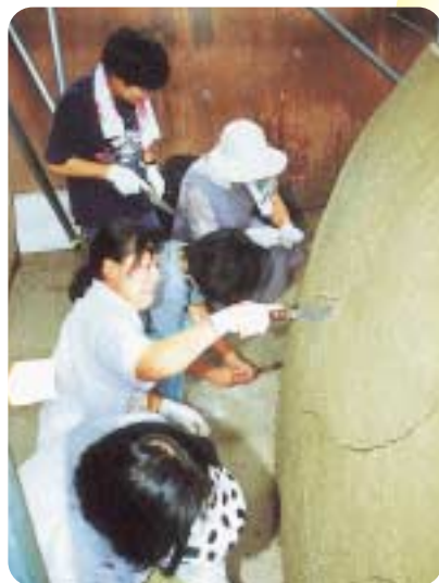
7月28日 成型した本体を分割

構造 鉄筋コンクリート造 陶版貼り付け 大きさ 高さ7m 長さ8m 幅6m 総重量 20t(雄竜頭部 1.1t 雌竜頭部 0.8t) 陶版のうろこ 約350枚 町民ボランティア 2515人