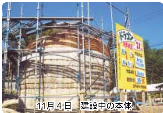
11月4日 建設中の本体