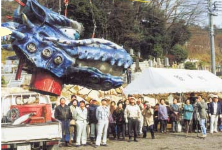
3月3日 頭部取り付け