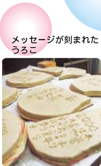
メッセージが刻まれた うろこ