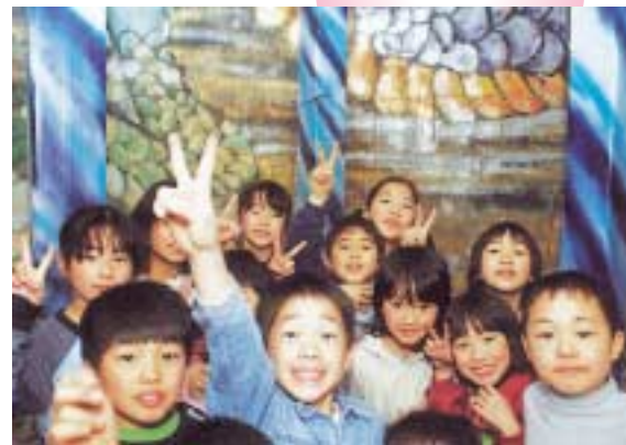
4月14日 完成式(本体の内部)