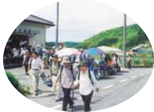
ちょっといっぱく(萩原公会堂)