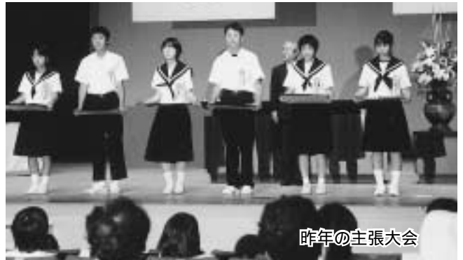
昨年(前年)の主張大会