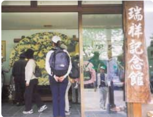
世界一の大皿(瑞祥記念館)