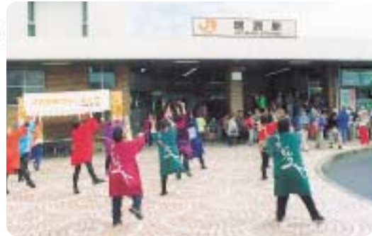
バサラでウェルカム!