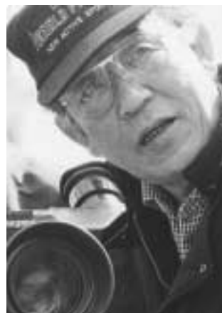
(ドラマ撮影中の様子等)