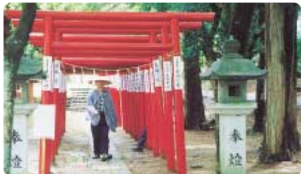
鳥居をくぐる旅人さん(稲荷神社)