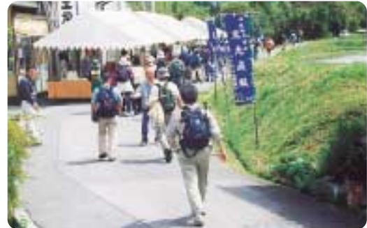
いらっしやい!いらっしやい!陶器販売市