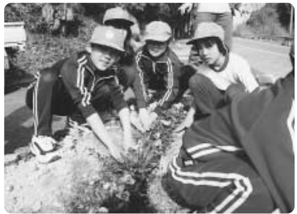
4月17日 大湫宿ホテルとトンボの遊涌パーク花植え