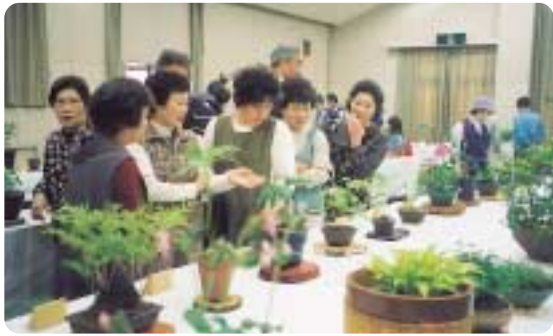
春がいっぱい！ 山野草展