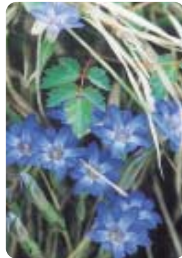
春リンドウもお出迎え

「温かく迎えて、さわやかに送る」 ティアの皆さんは、200人余り 当日お手伝いいただいたボラン 動を与えることができるのです。 ありふれた風景も、訪れる人に感 私たちの眼には何の変哲もない 風山に登ってみたい! 賛辞の数々 を戴きました。 ー スでした。もう一度来たい! 屏 風山に登ってみたい! 賛辞の数々 を戴きました。 受付が始まる頃には雨も上がり、 絶好のハイキング日和となり、訪 れた人たちは、小川のせせらぎ、 鳥のさえずり、薄緑の早苗の揃っ た田園風景、眩いばかりに輝く新 緑、何気ない史跡に新鮮な感動を 呼び覚まされたようです。異口同 音に「変化に富んだ素晴らしいコ ー スでした。もう一度来たい! 屏 風山に登ってみたい! 賛辞の数々 を戴きました。 昨年「明日の稲津を築くまち づくり推進協議会」が中心となっ て、JR東海の協力のもとに計画 を進めてきたものです、 「他を圧倒するような観光資源が ない稲津町に、果たして人が来て くれるのだろうか」そんな不安を 抱えながら始めたのですが、そん な懸念を一掃しました。 このさわやかウォーキングは、 00人が参加、雨に洗われた清々 しい新緑を満喫しました。 ゴールデンウィークの5月3日、 春のさわやかウォーキングが行わ れました。夜来からの雨に出鼻を 挫かれたにもかかわらず、1、5