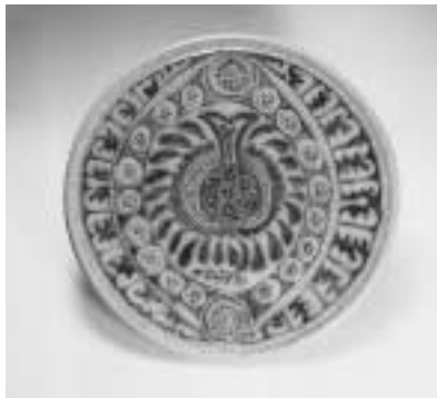
塩釉瑠璃釉陰刻紋称大皿

昭和40年代から50年代初めにかけて作られた、塩釉陶器(塩の釉薬)にスポットを当て、企画しました。多種多様な技法、釉法を駆使した格調高い異色の民芸風のやきものを展示します。