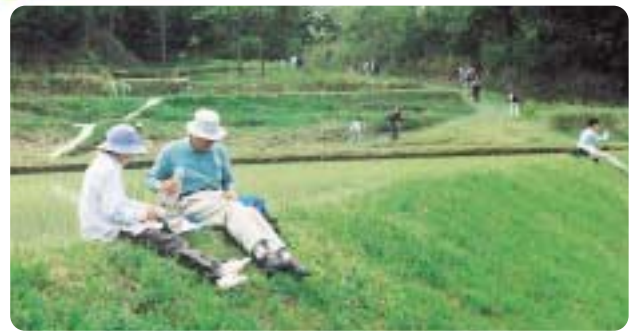
夫婦仲よく畔道でお昼ご飯

「う」を合い言葉に準備を進めて来ました。コースの所要場所に設置したイベント会場でも、ほのぼのとした交流が芽生えました。 稲津町では今回のさわやかウォーキングに備えて、上図のような里山ハイキングマップを発行しました。 これは、近年の自然志向、自然環境への意識の高まりの中、稲津まるごと自然公園構想の具現化を図るものです。町の豊かな自然と、歴史や文化を紹介し多くの人たちに、ふれあいと学習の場を提供したいと思っています。 さわやかウォーキングをきっかけに、稲津町再発見と郷土に誇りと愛着の持てるまちづくりに向けて、その第一歩を踏み出しました。