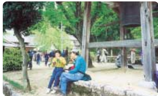
ちょっといっぱく(普濟寺)