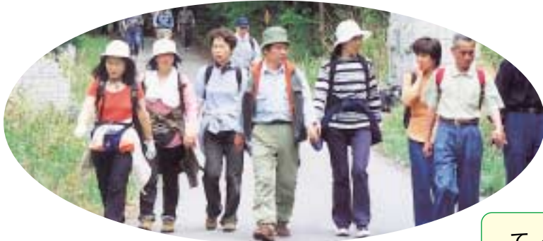
新緑あふれる屏風山林道を歩く人たち