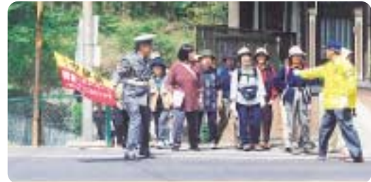
交通整理するボランティアの皆さん