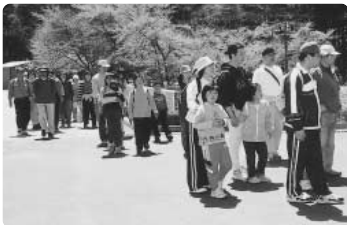
4月22日 陶子連追跡ハイク