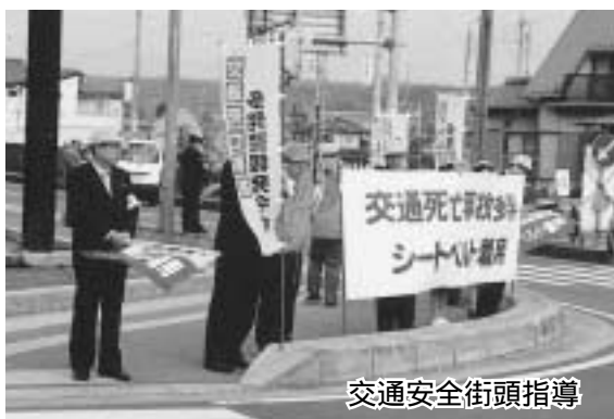
交通安全街頭指導