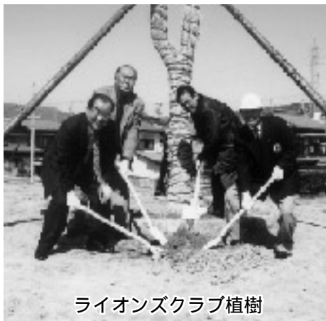
ライオンズクラブ植樹