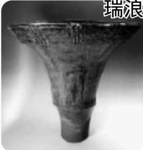
萌 - kizashi-II