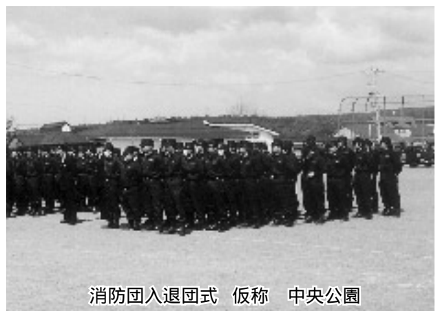
消防団入退団式 仮称 中央公園