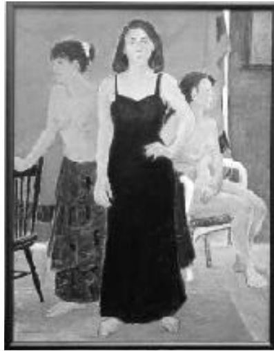
渡辺英子さんの作品「モデル達」(洋画の部)