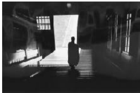
加藤安一さんの作品「静寂」(写真の部)