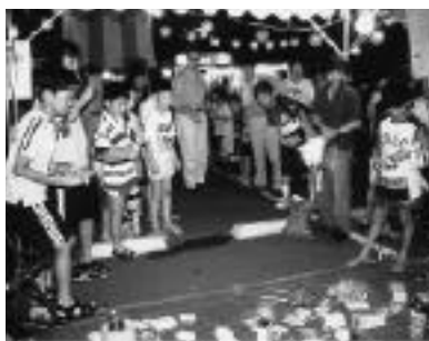
盆踊り大会での催し

のモデル地区の指定を機に、親子の触れ合いや、青少年が地域との触れ合いを持ち、新しい地域の在り方を考えてみることにしました。