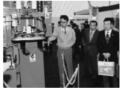
セラミックマシンショウ'98みずなみ

から25日までの3日間、明世町の市民公園で開かれました。地場産業である窯業の様々な情報を全国に向けて発信しようと、県内外から30社の出展があり、地元窯業界の洗練された技術が披露されました。