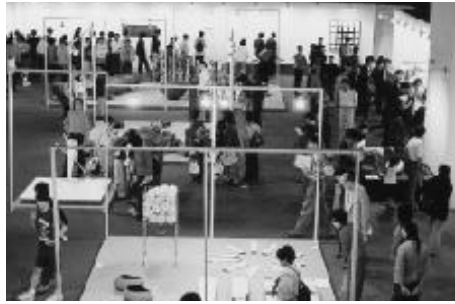
国際陶磁器フェスティバル美濃'98

東濃地方最大の窯業祭典である「国際陶磁器フェスティバル美濃'98」が10月23日から11月3日まで、多治見市総合体育館を会場として開催されました。陶磁器産業・文化の発展を目的として3年ごとに開催されているこの祭典も5回目を迎え、様々な趣向が凝らされた楽しいイベントが催されました。また、最新の窯業関連機械等を展示する「セラミックマシンショウ'98みずなみ」が10月23日