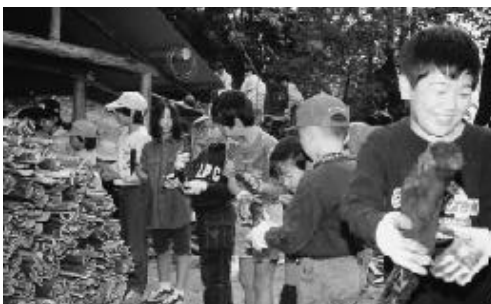
木炭を運び出す子どもたち