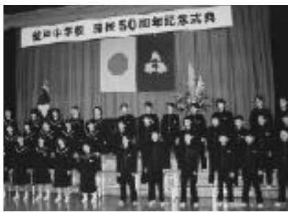
合唱発表をする生徒たち

式典では、開校当時の学校の様子の話があり、生徒たちは狭かったグラウンドなどの興味深い話に聞き入りました。また、合唱の発表も行われ、生徒たちの澄んだ歌声が披露されました。会場となった屋内運動場には、卒業生や昔の釜戸中学校の写真が飾られ、訪れた人たちは熱心に見入っていました。また、記念誌「追憶 我が母校」が発行され、校区内の各世帯に配付されました。