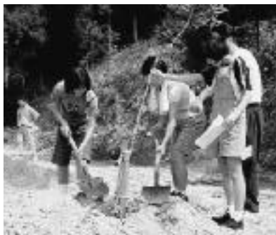
▶天徳もんじやの森の記念植樹