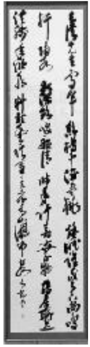
河村良夫さんの作品「中夜枕上口号」(書の部)