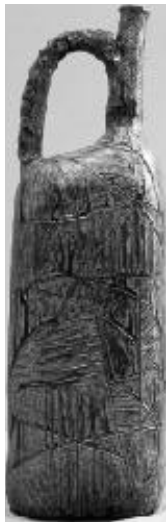
伊野重幸さんの 作品「青の刻線」 (陶芸の部)