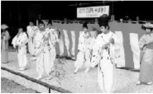
諏訪神社の鶴城笛踊り