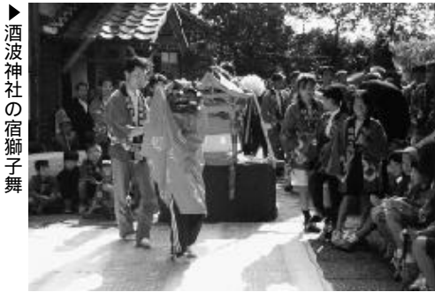
酒波神社の宿獅子舞