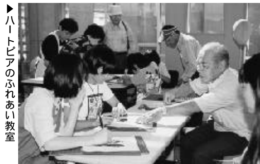
▶ ハートピアのふれあい教室