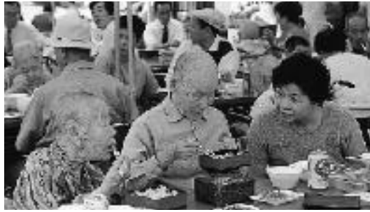
食事を楽しむみなさん

9月13日、特別養護老人ホーム『みずなみ陶生苑』で敬老会が行われました。 敬老会では、入所者全員に記念品が贈られたあと、幸栄会のみなさんによる三味線演奏が披露されました。 昼食会には、ボランティアの無患子による五平餅のサービスや豚汁・アイスクリームなどの模擬店も出されました。 また、男子職員による余興やビンゴゲームなどもあり、みなさんは一家そろっての楽しい食事を楽しんでいました。