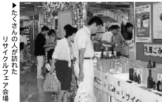
▶たくさんの方が訪れたリサイクルフェア会場