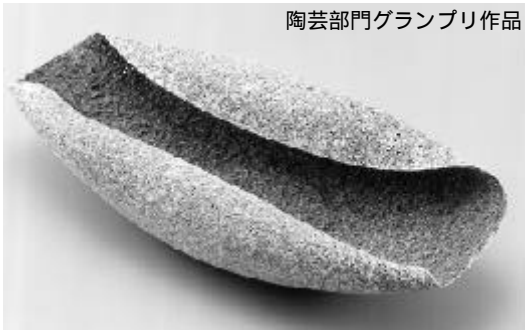
陶芸部門グランプリ作品