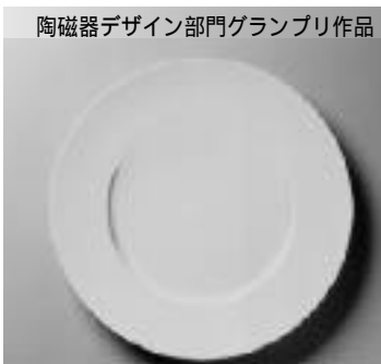
陶磁器デザイン部門グランプリ作品

森と湖の国、フィンランドを象徴する、自然や環境と人間との深く長いかかわりの中から生まれた精緻なデザインの陶磁器を集めて紹介します。その中から、代表的な23名と1グループ42作品の紹介・展示。それらが織り成す「光と影」の心地よさを体感いただけることでしょうか。