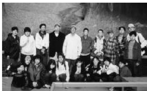
マウントオルガにて

こんな大自然に囲まれていると、今までちょっとしたことでも悩んでいた自分がとても小さな人間に思えました。先住民の生活にも触れることができました。