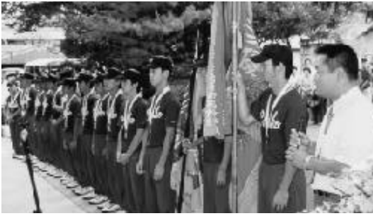
全国優勝を果たした中京商業高校軟式野球部のみなさん