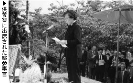
▶ 供養祭に出席された姚参事官

岐阜県内の旧中山道には32カ所構築されましたが、そのほとんどが廃頽し、瑞浪市内のように4カ所すべてが残っている例は全国的にもまれです。