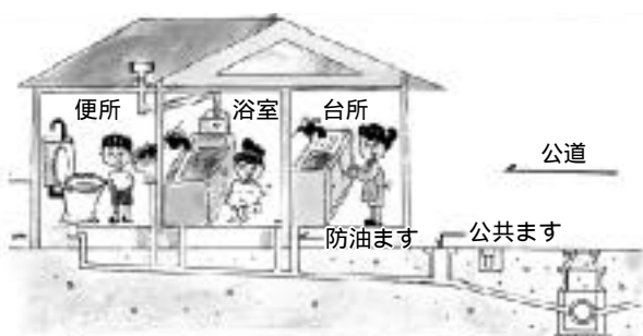
個人が施工する施設

汚水は処理場に集め浄化してから川に放流しますので、公共水域や湖沼の水質保全により汚れた川や海がよみがえります。