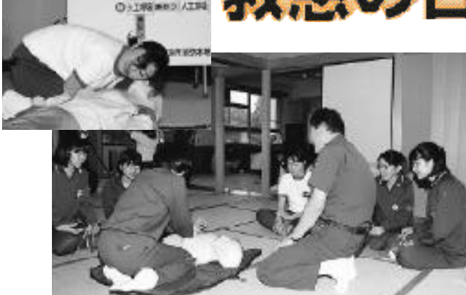
上級救命講習を受ける瑞浪高校3年生活設計コースのみなさん