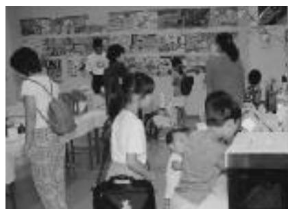
昨年の発明くふう展と思いつき作品展