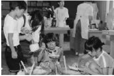
釉薬をかける参加者のみなさん