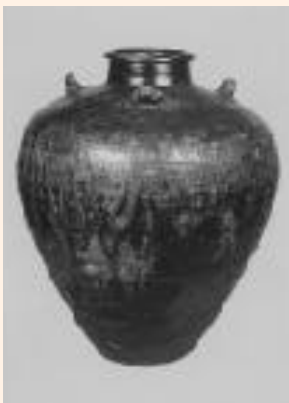
常設展示の入館料でご覧になれます。