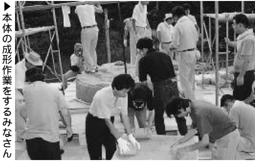
▶ 本体の成形作業をするみなさん