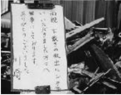
◀クローズアップしてみると...