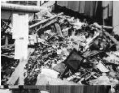
▶完全に崩壊しガレキの山となった家

毎年訪れる防災の日、これを確かめ、あらためて気を引き締める絶好の機会となっている。