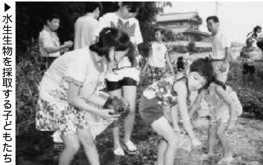
▶水生生物を採取する子どもたち

7月30日、日吉町の平岩川で 水生生物を観察する「カワゲラ ウオツチング」が行われました。 この観察会は河川の水質を調 べるために毎年行われており、 今年も地元の子ども会から25人 の小學生らに参加しました。 子どもたちは保健所職員の手 導により、川の中の生きものを 探し、きれいな川にすむヘビト ンボの幼虫などを見つけたと、 大きな歓声を上げていました。 調査の結果、平岩川の水質階 級は、今年も昨年同様ランク のきれいな水に該当しました。