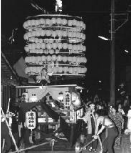
宿場内を練り歩く山車船