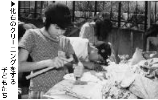
化石のクリーニングをする子どもたち

琵琶峠には、往時の面影を残す道標・石仏・一里塚などが現存し、昭和45年には、500m余にわたる石畳が確認されました。 うちいでのはまのき しんじゅつきこう き そじめいしよす 『打出浜記』『壬戌紀行』『木曾路名所図会』などに名所・難所として詳しく述べられており、また、『木曾街道六十九次』などにこの峠付近一帯に露出する巨岩が描かれています。