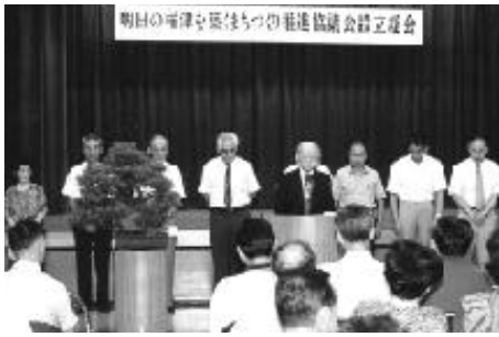
あいさつする成瀬会長と役員のみなさん