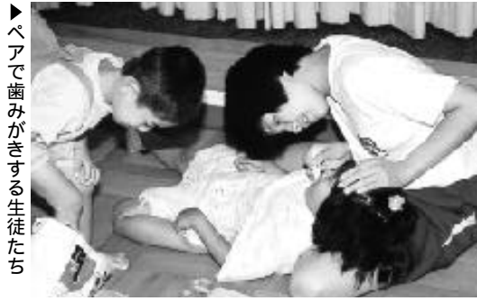
▶ベアで歯みがきする生徒たち

期 日 = 8月9日(日) 9時より 場 所 = 瑞浪陶磁資料館・作陶室 定 員 = いずれも20人 受 講 料 = いずれも1,000円 申 込 期 限 = 8月8日(土) 申 込 先 = 瑞浪陶磁資料館 ☎68-2506)