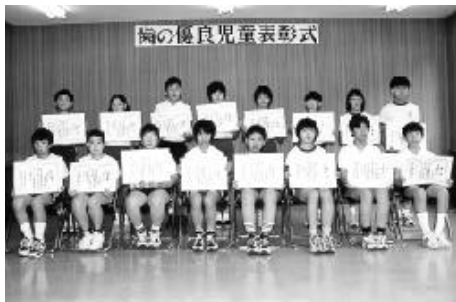
表彰された歯の優良児童のみなさん

7月16日、陶中学校の生徒が陶幼稚園を訪れ、園児に歯みがきの指導をしました。 保健委員の生徒により、歯みがきの大切さを教える劇が披露されたあと、3年生の生徒61人が園児とベアを組みました。 生徒のみなさんは、園児の歯の数を調べたり、みがき残しやみがき方、歯ブラシの状態などをチェックしながら、正しい歯のみがき方を指導しました。 園児たちは、指導を受けながら、お兄さんお姉さんとの交流を楽しんでいました。