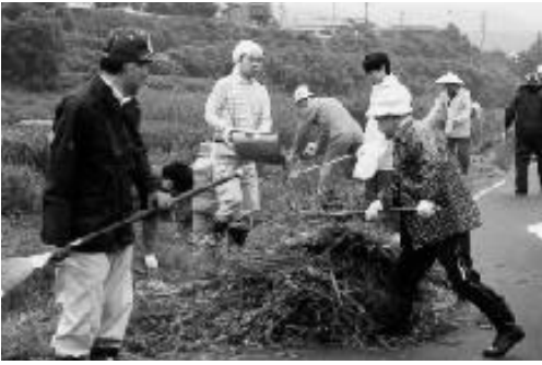
▶清掃作業をするみなさん