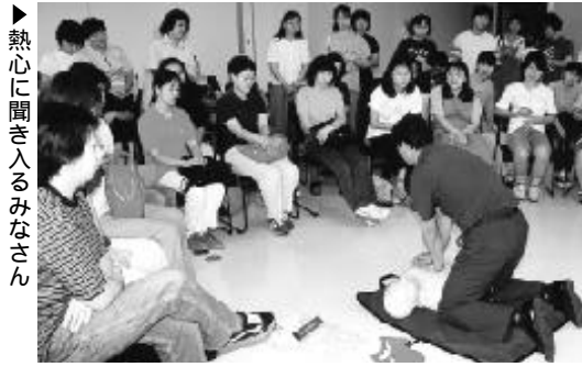
▶熱心に聞き入るみなさん

会期 8月30日(日)まで 休館日 毎週月曜日、7月21日(火)・22日(水) 常設展示の入館料でご覧になれます