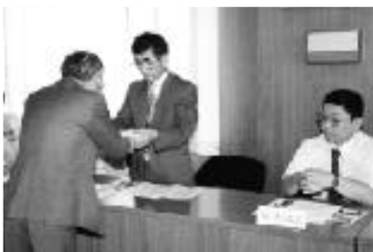
委嘱を受ける監視員のみなさん