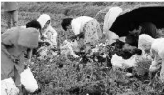
一生懸命じゃがいもを掘るみなさん

環境月間の6月14日、土岐川河川清掃が行われました。この活動は、土岐川の名滝橋から和合大橋までの兩岸や支流の清掃作業を行うもので、土岐川を美しくする会のメンバーや周辺の自治会、中京商業高校の生徒など約三、二〇〇人が参加しました。 あいにくの雨模様の中、みなさんは自分たちのまちをきれいにしようと、草刈りやごみ拾いに快い汗を流していました。この日集められた草やごみの量は、61トンにもなりました。