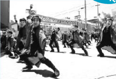
「YOSAKOIソーラン祭り」での熱演

七夕まつりを支援しようと結成された『バサラ瑞浪普及振興会』では、8月の七夕まつり本番に向けて、踊りの輪を市民全体に広げようと練習に取り組んでいます。