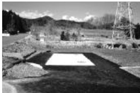
大湫町足又の防火水そう

より生じた自然および生活環境への影響を緩和するために「水力発電施設周辺地域交付金」を交付しています。