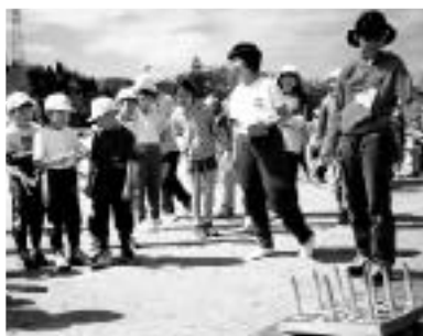
ゲームを楽しむ子どもたち

4月26日、陶子ども会連合会の追跡ハイクが陶小学校グラウンドを発着点に行われました。第25回となる今年、小学生の親子やお手伝いの中学生など約八三〇人が参加し、さわやかに晴れ渡った一日を、緑あふれる自然の中で楽しみました。参加者たちは、みんなで助け合いクイズやパズルを解いたり、輪投げやサイコロゲームなどで得点を競い合ったりして、楽しそうに歩いていました。