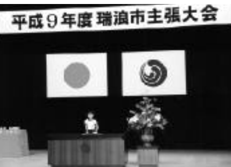
▶ 昨年度の主張大会の様子