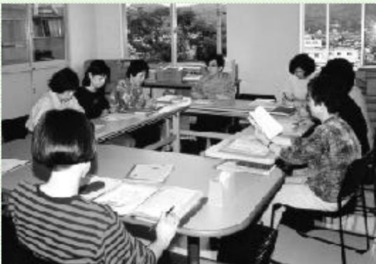
活動について話し合うともしび会のみなさん

世界一のこま犬のある陶町大川のこま犬売店では、こま犬を見学される方のために、地元のみなさんがボランティアでこま犬グッズ、五平餅や焼き鳥などを販売しています。5月はもちらん、春・秋の行楽シーズンなどの日曜・祝日に営業していますので、どうぞご利用ください。