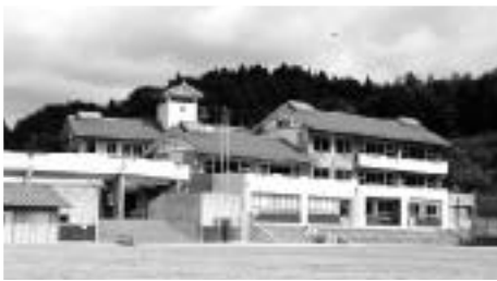
稲津中学校新校舎