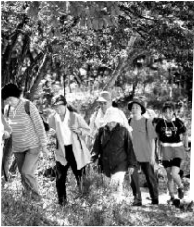
新緑の中をマイペースで歩くみなさん

4月25日・26日の両日、JR東海の「春のさわやかウォーキング」が竜吟の滝や中山道、大湫宿を回るコースで行われ、市