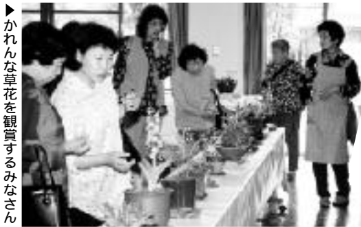
▶ かわいい草花を觀賞するみなさん