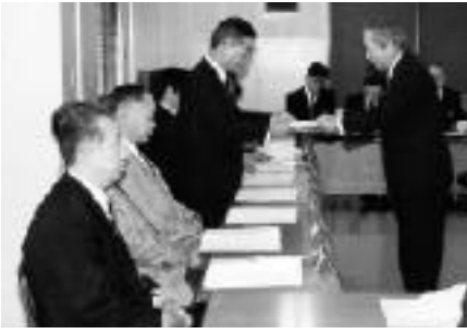
社会教育委員の委嘱式