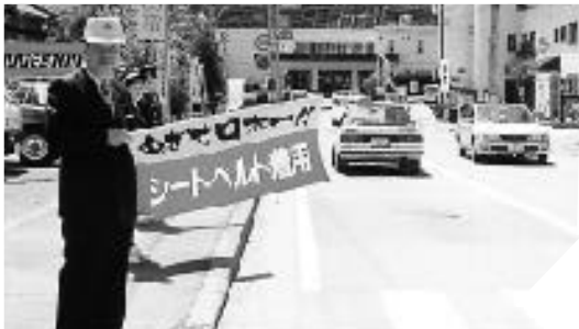
シートベルト着用を呼びかける高嶋市長ら

春の全国交通安全運動の実施期間中の4月10日、市役所前の市道でシートベルト着用の街頭啓発が行われました。これは、シートベルト着用を呼びかけ、一人でも交通死者を減らそうと実施されたものです。この日は、高嶋市長をはじめ、交通安全協会の役員、警察や市の職員など約20名が「シートベルト着用」と書かれた旗などをもち、シートベルトの着用を呼びかけました。運転者・同乗者は、必ずシートベルトを着用しましょう。