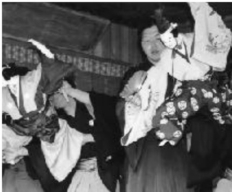
式三番叟を奉納する青年部のみなさん