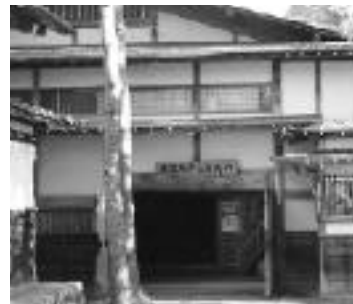
美濃歌舞伎博物館「相生座」