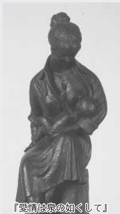
『愛情は泉の如くして』