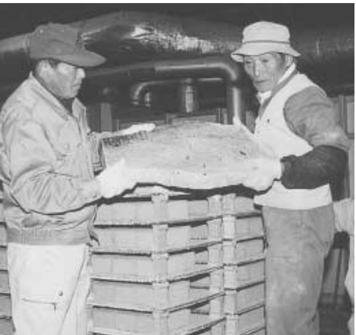
窯出し（多治見工業にて）