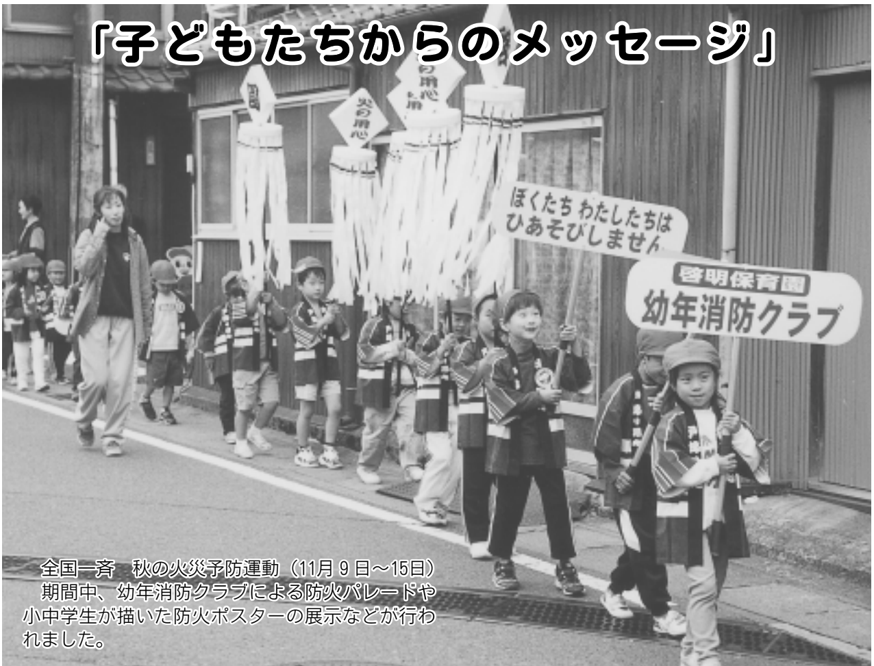
全国一斉 秋の火災予防運動（11月9日～15日） 期間中、幼年消防クラブによる防火パレードや 小中学生が描いた防火ポスターの展示などが行われ ました。