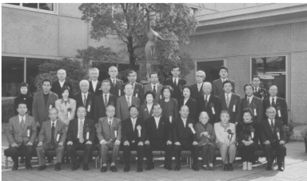
▲感謝状を受けられたみなさん

瑞浪市功労者表彰式が11月21日市役所で行われました。瑞浪市に功績のあった27人に表彰状が、また多額の寄付をされた方など、21人と18団体に感謝状が贈られました。 (敬称略)