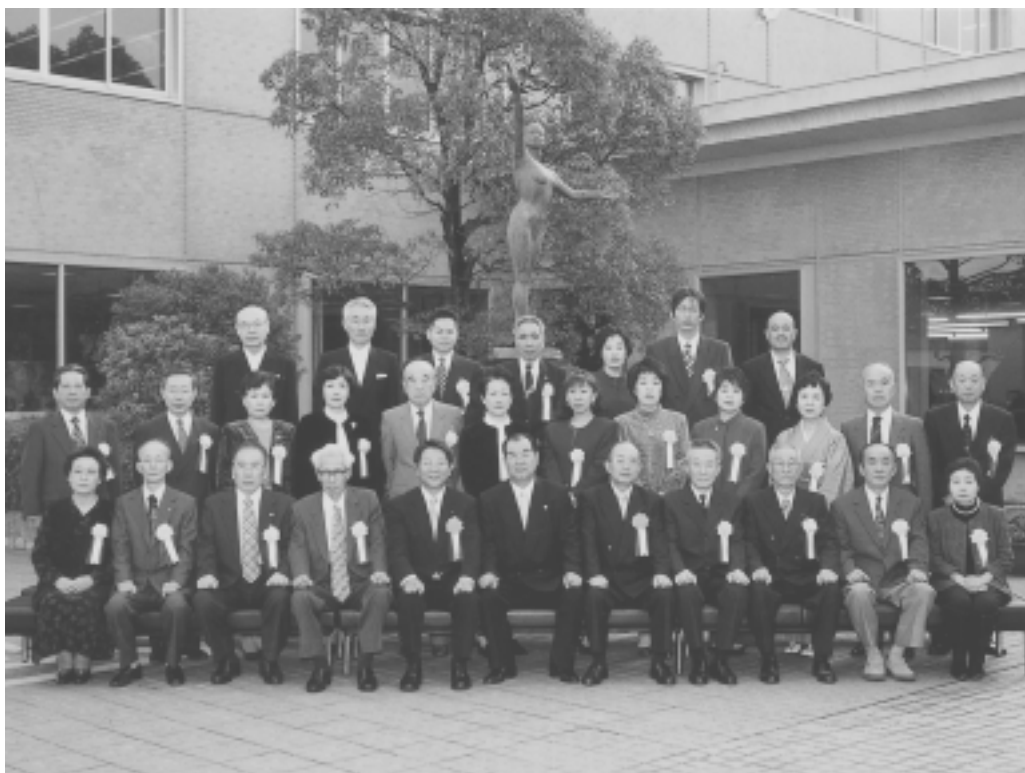
▲瑞浪市功労者表彰を受けられたみなさん