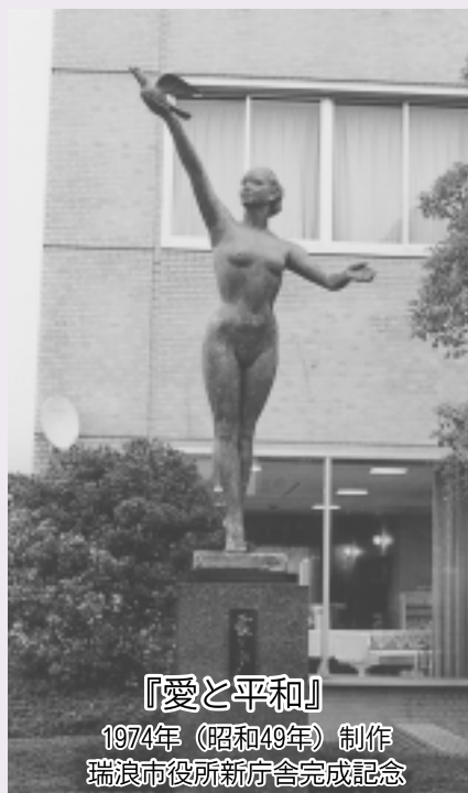
『愛と平和』 1974年(昭和49年)制作 瑞浪市役所新庁舎完成記念 として設置される