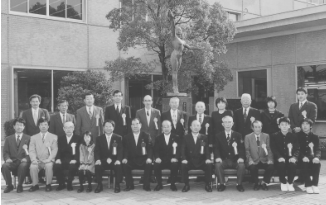
▲教育功勞者表彰・感謝状を受けられたみなさん

教育功勞者表彰が、11月21日市役所で行われました。教育、文化、体育などの振興発展に功績のあった12人と小中学校6校が表彰を受けられ、また1人に感謝状が贈られました。(敬称略)