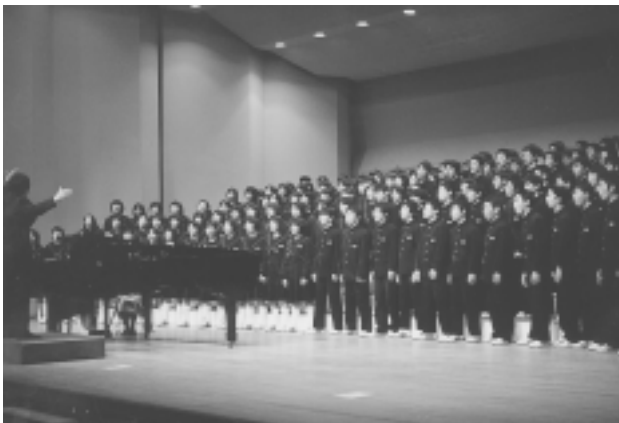
11月17日 第47回瑞浪市小中音楽会(総合文化センター)

テレビ・エアコン・冷蔵庫・洗濯機の4品目について、不要になつて出す時は、消費者は、リサイクル費用を負担しなければなりません。