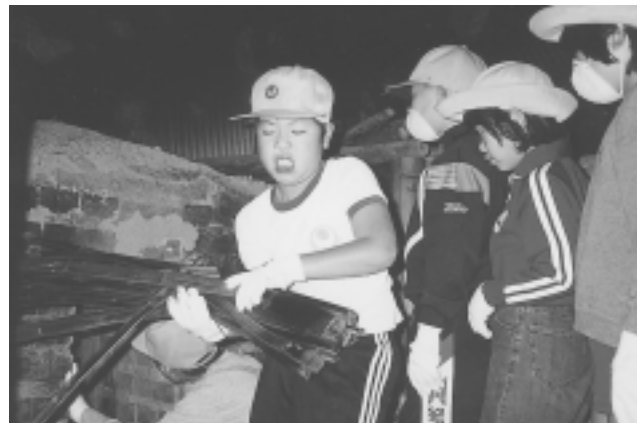
11月2日 明世小学校3年生炭焼体験(大湫町)