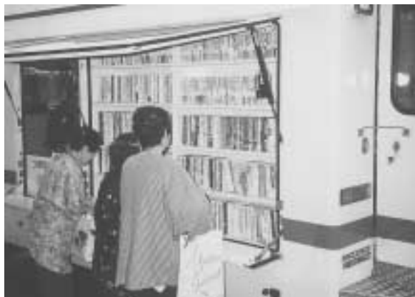
▲ 巡回中のこまどり号 (細久手ステーション)

『こまどり号』からのお知らせ!! 図書館から遠い方や車で来館できない方のために、移動図書館車(こまどり号)が毎月各ステーションを巡回しています。 「こまどり号」には、千冊ほどの本が積載されていて、ご希望の図書がないときには、リクエスト制度を設けています。 これは、読みたい本を予約することによって、次の巡回日に、あなたの最寄りのステーションまでお届けする制度です。 『読書の秋』です「こまどり号」をおおいにご利用ください。