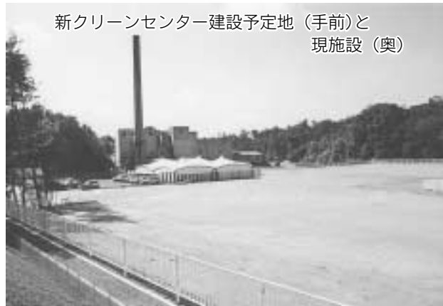
新クリーンセンター建設予定地（手前）と 現施設（奥）

10月24日、日吉町で新しい可燃ごみ焼却施設の起工式が行われました。これは、現施設（1982年稼働）の老朽化、国のダイオキシン排出規制の強化に対応し建設するもので、施設は24時間稼働、一日当たり可燃ごみ45トン、下水道汚泥5トンを処理するものです。敷地面積 11200㎡、建築延べ面積2050㎡、建設費28億5600万円、平成14年6月の完成を目指しています。