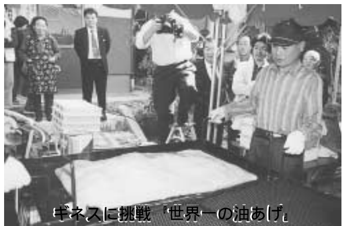
ギネスに挑戦 『世界一の油あげ』

11月4日 土岐小学校前の河原で小学生と地元のお年寄りら750人が参加して芋煮会が行われました。