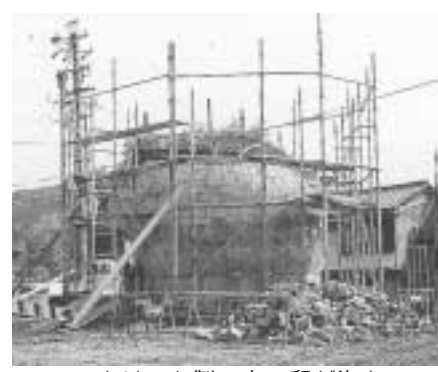
コンクリート製の竜の卵が姿を現しました。