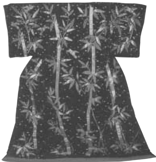
くろじゆす じきんしゆうたけ すずめもん うちかけ 黒縞子地金縷竹に雀文「裌襦」

仙台藩伊達家の家督争いに題材を採った『伽羅先代萩』の乳母政岡の役衣裳 (江戸時代末期)