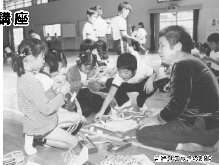
割箸ひこうきの制作

10月24日、日吉寿大学のみなさん22人が日吉小学校（190人）を訪れ、児童と交流を行いました。 お年寄りと子どもの触れ合う機会を設け、地域の文化を伝えることを目的としたこの交流は、昨年続き2回目となります。 1年生から4年生は、紙鉄砲や竹のけん玉など昔ながらの遊びを、道具作りから体験しました。 また、6年生は、日吉町の文化財をテーマにした講話を聞き、地域文化への理解を深めました。