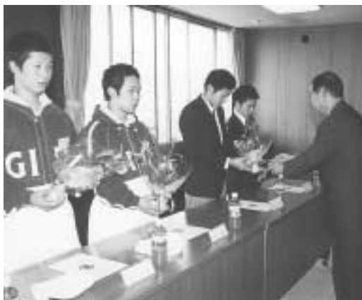
10月11日 国体壮行会（瑞浪市役所）