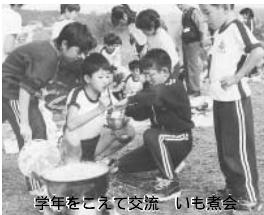
学年をこえて交流 いも煮会

高齢者が高齢者を介護する時代を迎え、地域の語らいの場・ふれあいの場として、多くの方に利用していただくことが大切ではないでしょうか。