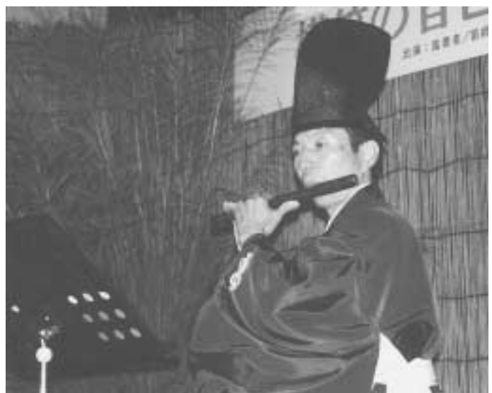
▲としょかんホームコンサート

日本古来の楽器の音色を聴く「としょかんホームコンサート」が9月23日、市民図書館で開催され、約250人のみなさんが繊細な音の調べを楽しみました。