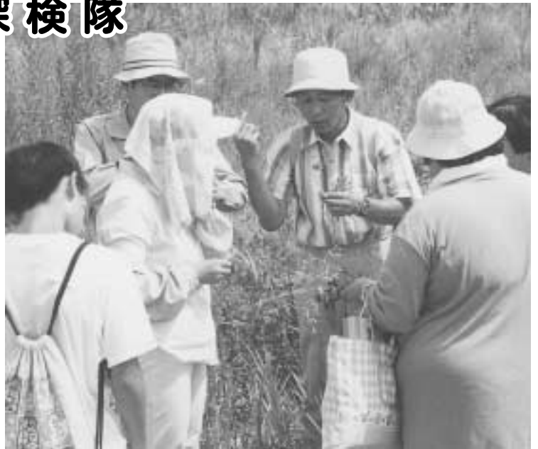
8月26日 夏の植物観察

中央公民館（総合文化センター）の自然観察講座を知っていますか。 年6回の講座を通じ、市中央部を貫く土岐川を学習の場としながら、人と自然の関わりを様々な角度から検証しています。 一人でも、親子でも、一回のみの参加も結構です。