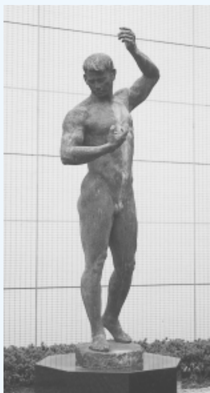
『破る』 日展菊花賞 1962年制作 (瑞浪市民体育館)