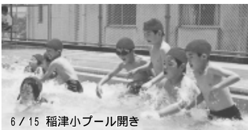
6 / 15 稲津小プール開き

定員等 = 瑞浪市民の親子20組 受講無料 (プール使用料が必要です) 問い合わせ スポーツ振興課 ☎68-0747