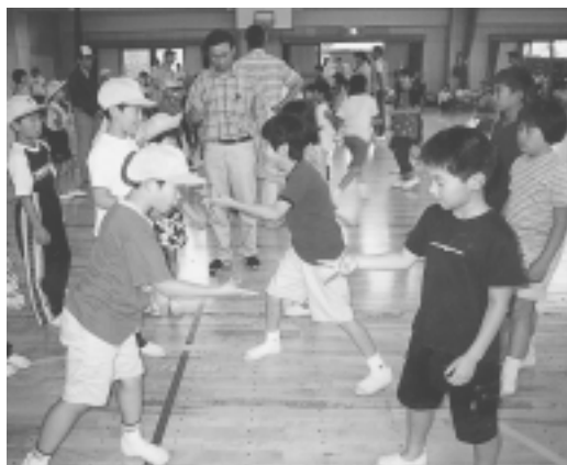
6/11 土岐地区子ども会連合会スポレク大会 (土岐小体育館)

お願い 検診時、肌シャツまたは、無地のTシャツ1枚だけで受診してください。(プリント、刺繍、ボタンなどは不可) 検診の結果、異常の無い場合は通知しませんので、ご了承ください。