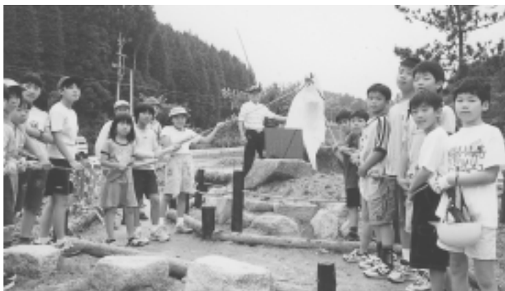
6/3 二宮金次郎像除幕式(土岐町 天徳もんじゃの森)