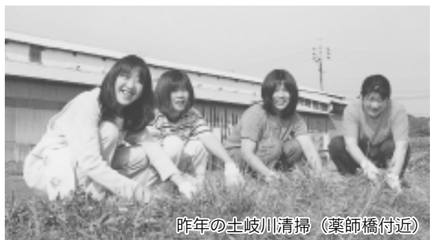
昨年の土岐川清掃(薬師橋付近)

広報みずなみ(題字 瑞浪市長) 発行/瑞浪市 〒509-6195 岐阜県瑞浪市上平町1丁目1番地 ☎68-2111 http://www.city.mizunami.gifu.jp/index.html