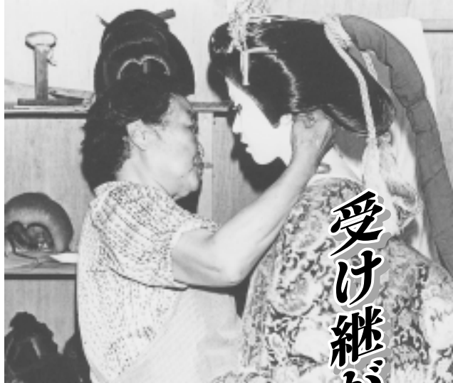
出番前（安藤のおばちゃん）