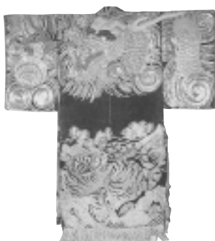
黒天鷲絨地金繡龍虎文四太

また太夫や三味線、顔師の方達も東濃各地を巡りながら、今の地歌舞伎ブームを支えていらっしゃいます。美濃の地歌舞伎には、今の地歌舞伎が失ってしまつたもの、あるいは切り捨てたもの、泥臭さや残酷さなど、この地域にしか無い所作(型)が今も残っています。歌舞伎の原点がここにあります。保存とは、古いものを、新しいもので再現することも含むと考えています。これからの保存継承を皆さんと共に考え、取り組んで行きたいと思えます。」