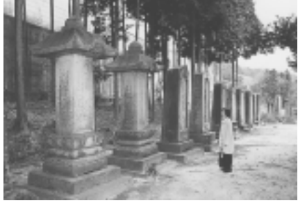
(ハナノキの山門ほか 文化財の宝庫)