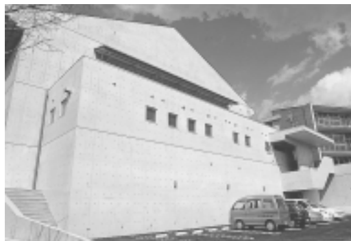
鉄筋コンクリート造(一部木造)平屋建 延床面積 1,146㎡

3月21日、釜戸中学校の屋内運動場が完成し、竣工式が行われました。これは、平成7年12月の大火災以来、同10年2月には新校舎が完成し、これでほぼ全体整備を終えました。