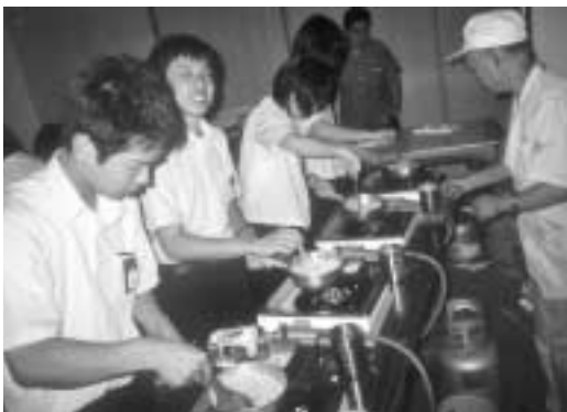
雷おこし工場での研修風景

たいこと(願い)をはっきりさせ、2学期以降の実践ボランティア)につなげます。2年生の職場体験学習、3年生の進路体験学習(東京)は、いずれも、自ら選んだ進路に基づき、自分たちで体験や研修の計画を立て、疑問や課題の解決に取り組んでいます。その結果を、パソコン学習で身につけた技術を駆使して、のびのびと表現できるまでになりつつあります。