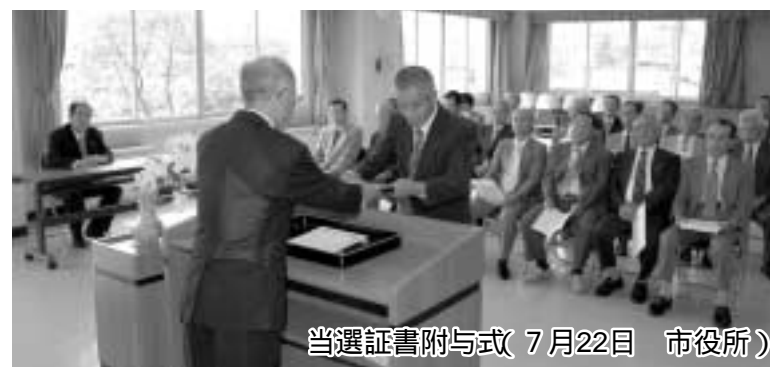
当選証書附与式(7月22日 市役所)