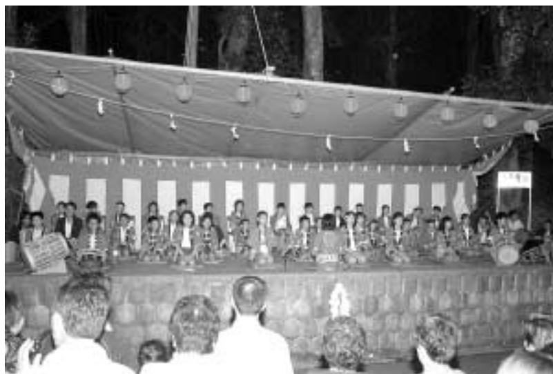
大川祇園祭(7月20日 陶町大川八王子神社)