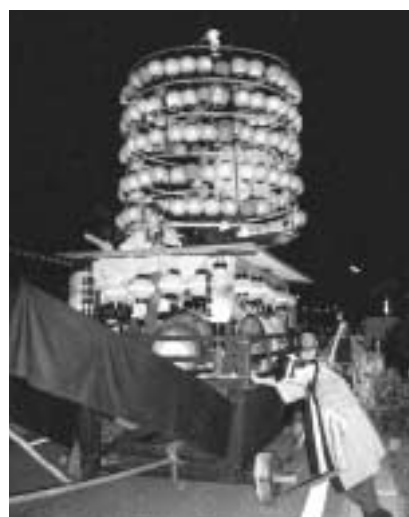
細久手ちょうちん祭り (7月27日 日吉町細久手)